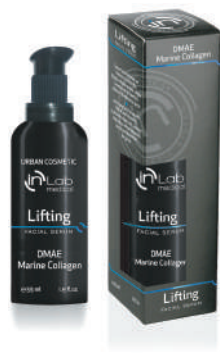
SERUM LIFTING 55ml