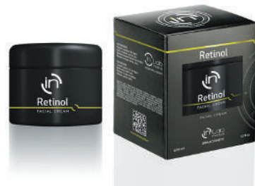
CREMA RETINOL 50ml