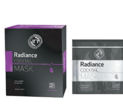
MÁSCARA DE CELULOSA 5 x 25ml