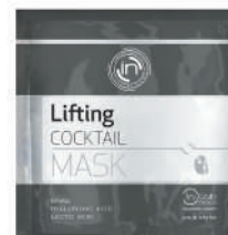
MÁSCARA DE CELULOSA 5 x 25ml