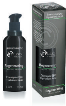
SERUM REGENERATING 55ml