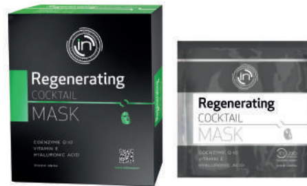
MÁSCARA DE CELULOSA 5 x 25ml