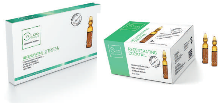
AMPOLLAS REGENERATING 2ml (10 - 30 uds)