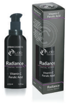
SERUM RADIANCE 55ml