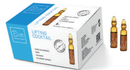
AMPOLLAS LIFTING 2ml. (10-30 uds)