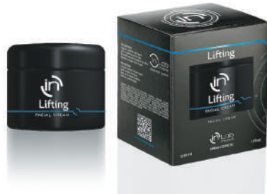
CREMA LIFTING 50ml