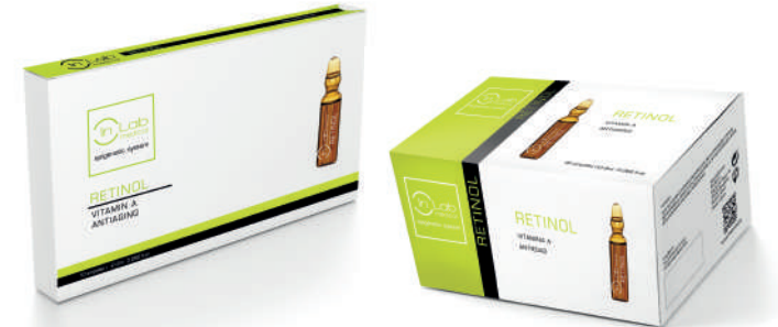
AMPOLLAS RETINOL 2ml. (10-30 uds)