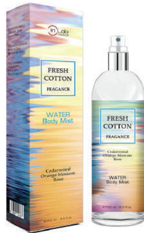
FRESH COTTON Water body mist