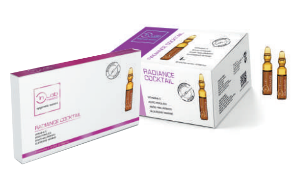
AMPOLLAS RADIANCE 2ml (10-30 uds)