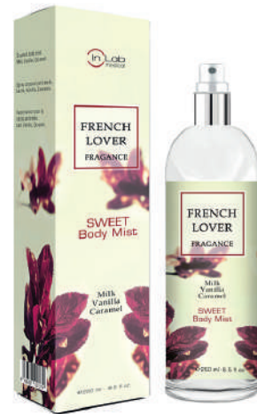
FRENCH LOVER Sweet body mist