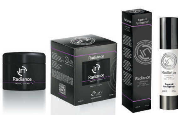
CREMA y GEL CREMA RADIANCE 50ml