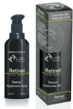
SERUM RETINOL 55ml