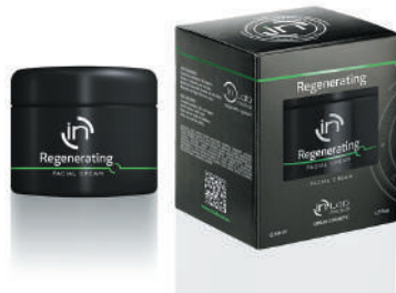
CREMA REGENERATING 50ml