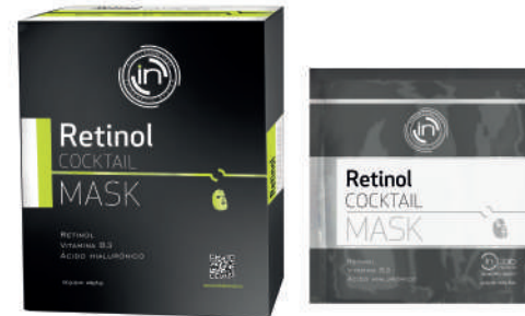
MÁSCARA DE CELULOSA 5 x 25ml