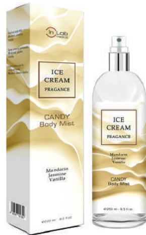
ICE CREAM Candy body mist