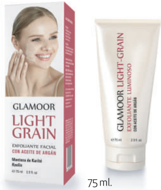
GLAMMOOR LIGHT GRAIN