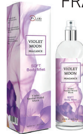
VIOLET MOON Soft body mist